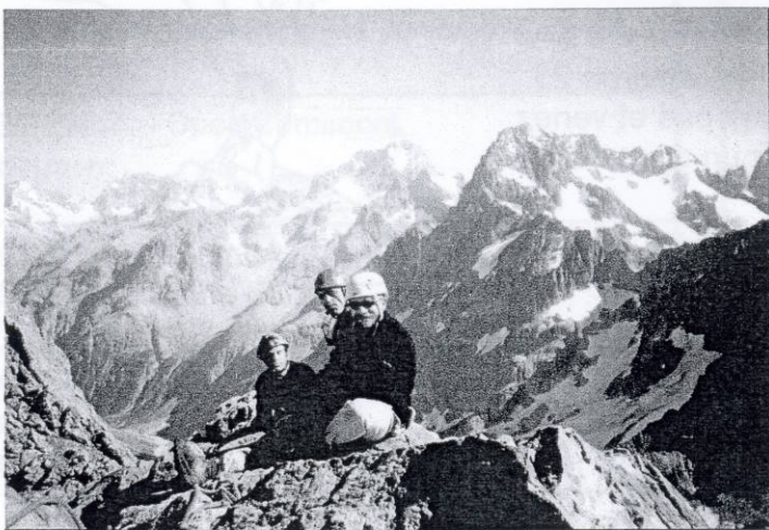
Les Enfants du Roc au sommet des Bans (3669m) en juillet 2002