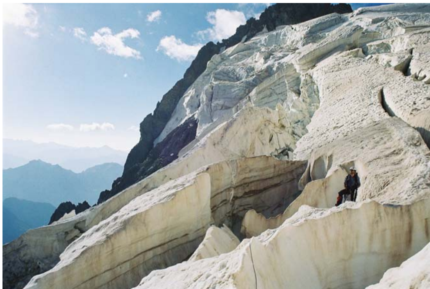
Thierry BEDEL sur le glacier des Violettes - traversée du Pelvoux - juillet 2003

Tél. 03 29 31 97 88 enfantsduroc@wanadoo.fr