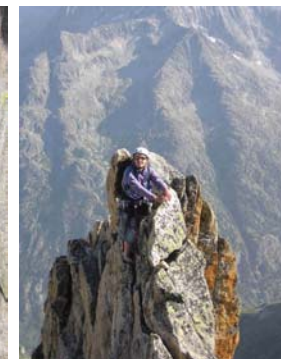
4 - Prendre son pied

Je profite de cette tribune pour ajouter une leçon n°0 : pour rentrer tôt, il faut partir tôt (pléonasme dites-vous ?) Ainsi qu'une leçon n°5 : pour rentrer avant la nuit, il faut souvent partir avant le soleil ... M.T.