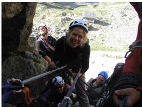
2 - Prendre patience