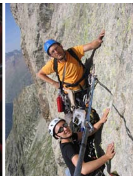
3 - Prendre l'air relax